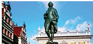
Statue von Johann Sebastian Bach

Reisepreise pro Person im Doppelzimmer 1.089 Euro im Einzelzimmer 1.375 Euro